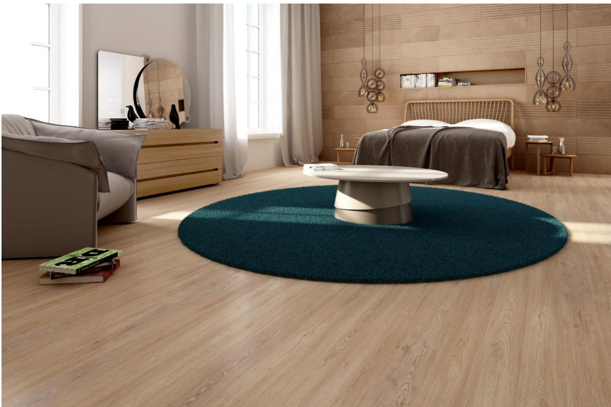
MAXIME 6871 als RUGX