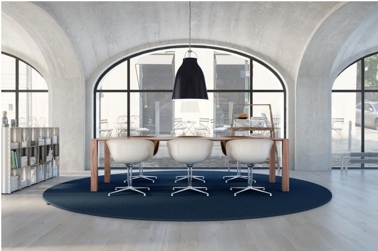
ALLURE 1011 als RUGX

„dive deep!“ wirkt ausgleichend auf die Seele und fördert Wohlbehagen und Balance. Die Sustained Color No. 6 entschleunigt, fördert die Kreativität und weckt Sehnsüchte. „Ein Leader“ sagt das Expertengremium zu dieser einzigartigen Farbe und empfiehlt die Kombination mit warmen Gegenspielern im Raum, wie natürlichen Hölzern und weiteren Naturmaterialien, wie zum Beispiel Leinen, Sisal oder Rattan.