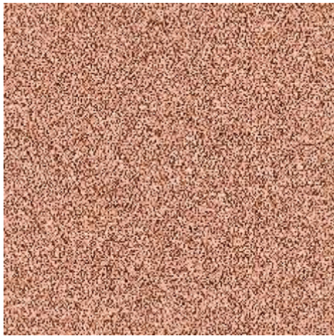
SKILL x CHILL1250