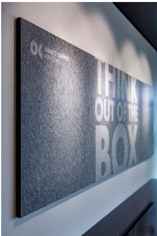
OBJECT CAMPUS AKADEMIE