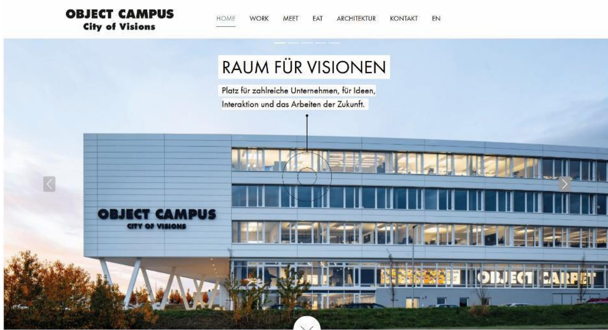
OBJECT CAMPUS