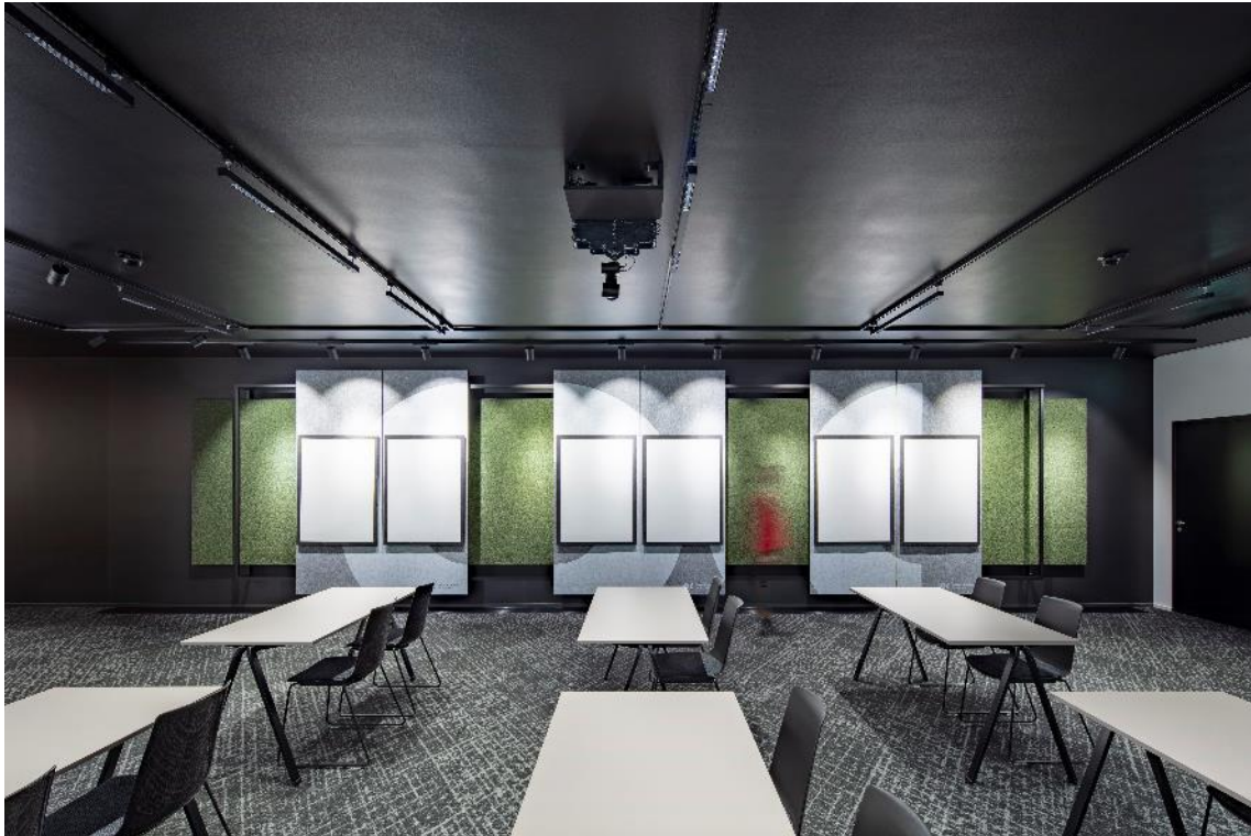
OBJECT CAMPUS AKADEMIE