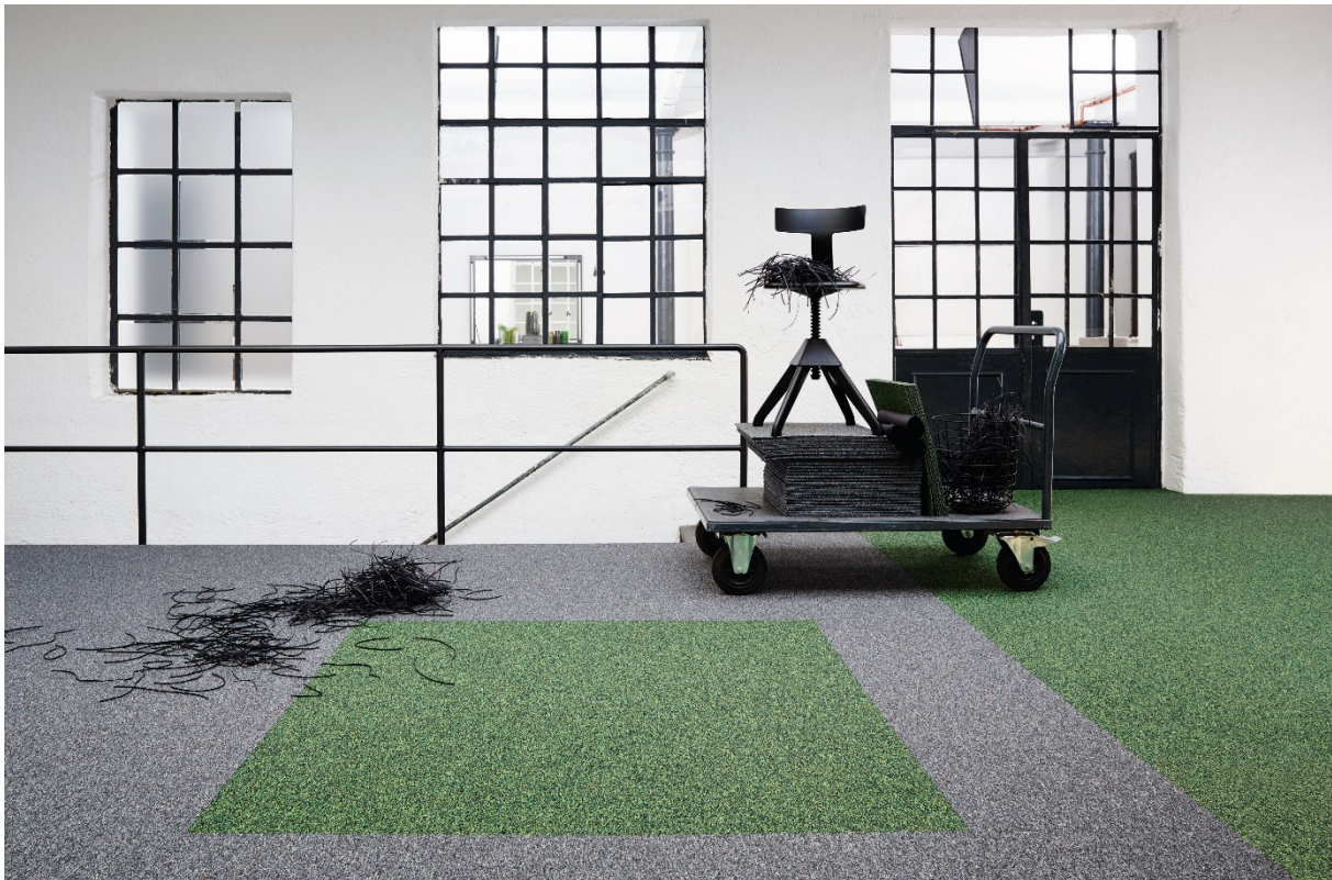
NYLLOOP 600 Fliese