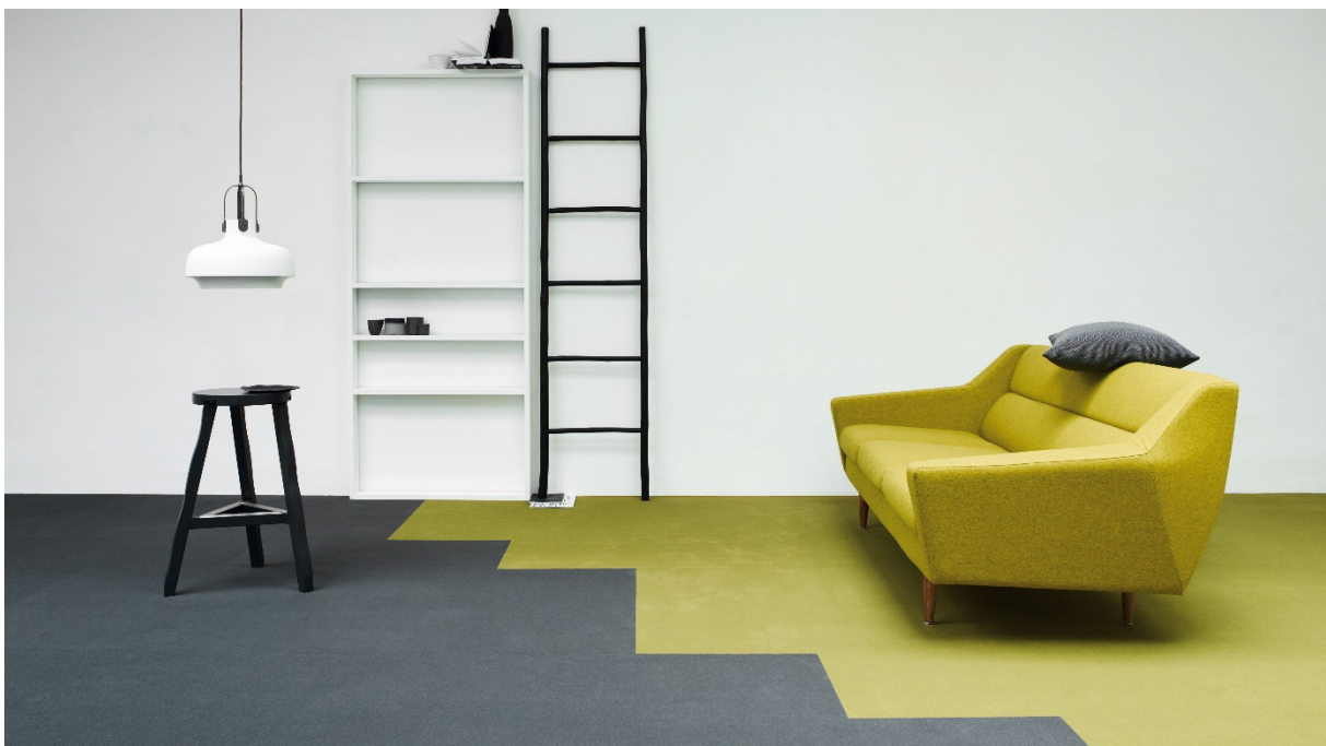
OBJECT 700 Fliese