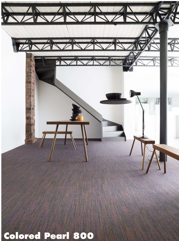
Colored Pearl 800

Die mehrfarbige Schlinge von Colored Pearl 800 fasziniert mit einer Konstruktion aus kräftigen Solution-Dyed-Fasern. Das zufällig erscheinende, tatsächlich wiederkehrende Muster wirkt besonders schmutzverbergend und macht die Qualität zu einem Allround-Genie.