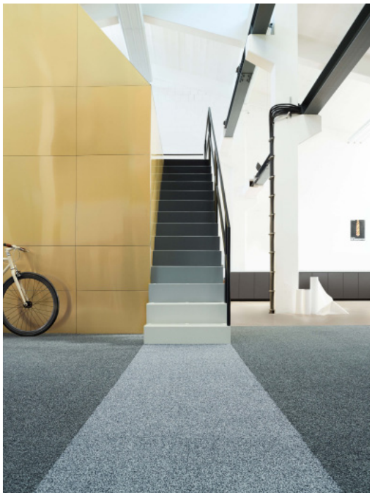
GRACCE 1100 Teppichfliese – auch als Bahnenware oder RUGX erhältlich