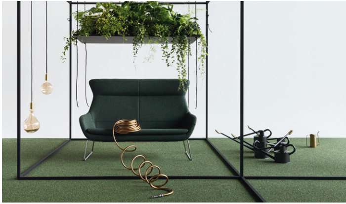
FINE 800 Teppichfliese – auch als Bahnenware oder RUGX erhältlich