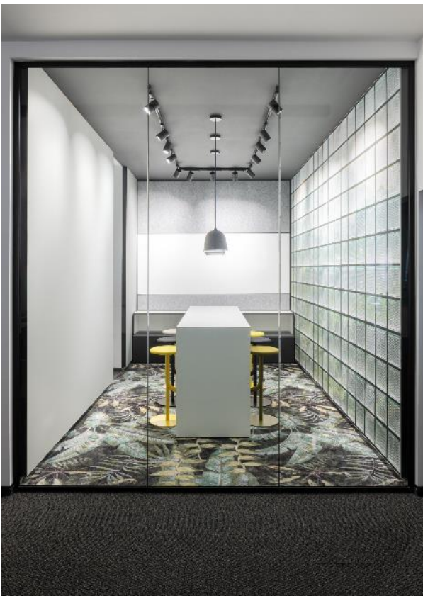
Brainstorming-Raum mit ruhig grafischer Wandfläche kombiniert mit dem floral-wilden Dschungelmotivboden Jane.