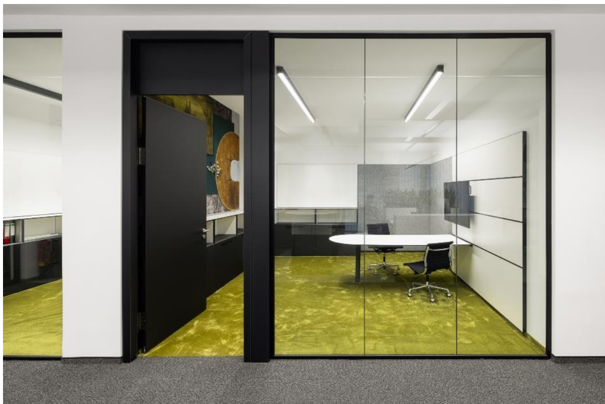
Meetingraum mit SILKY SEAL im Farbton Mate, der subtile Glanzeffekte mit faszinierenden Strukturen verbindet.