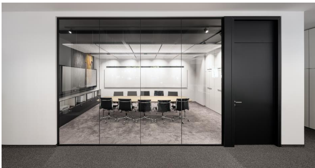
Konferenzraum mit dem weichem Glanzfrisé SMOOZY im Farbton Mauve.