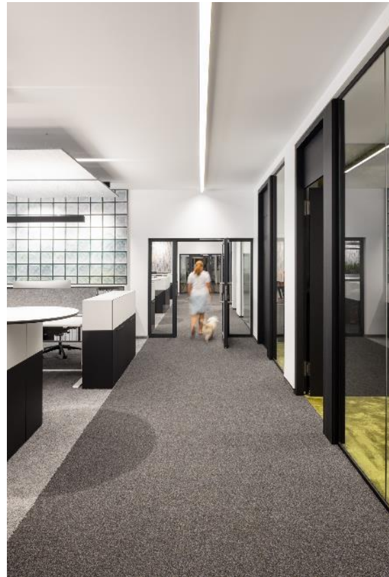
Links: Meetingraum mit SILKY SEAL im Farbton Mate, der subtile Glanzeffekte mit faszinierenden Strukturen verbindet. Rechts: NEOO, der erste zirkuläre Teppichboden aus nur einem Material, zoniert die Laufwege im Farbton Twilight.